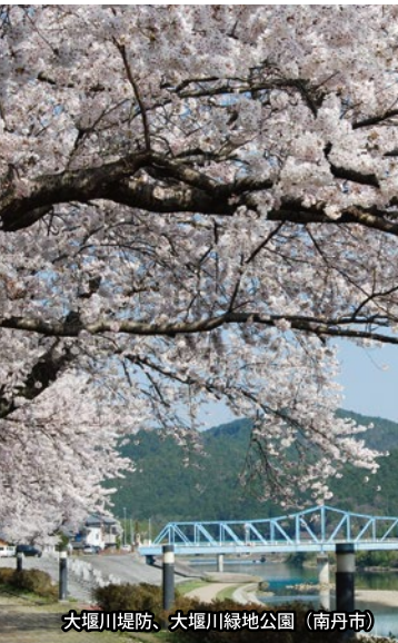
大堰川堤防、大堰川緑地公園（南丹市）

みつばつつじ：4月上旬～4月中旬 ・京丹後市久美浜町西本町 ☎0772-82-0163 ◆京都丹後鉄道宮豊線「久美浜」駅下車、徒歩15分 ◆山陰近畿自動車道野田川大宮道路「京丹後大宮」ICから約40分（28km）