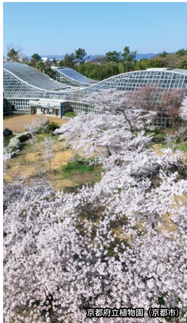
京都府立植物園（京都市）