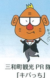
三和町観光PR隊長「キバッチ」