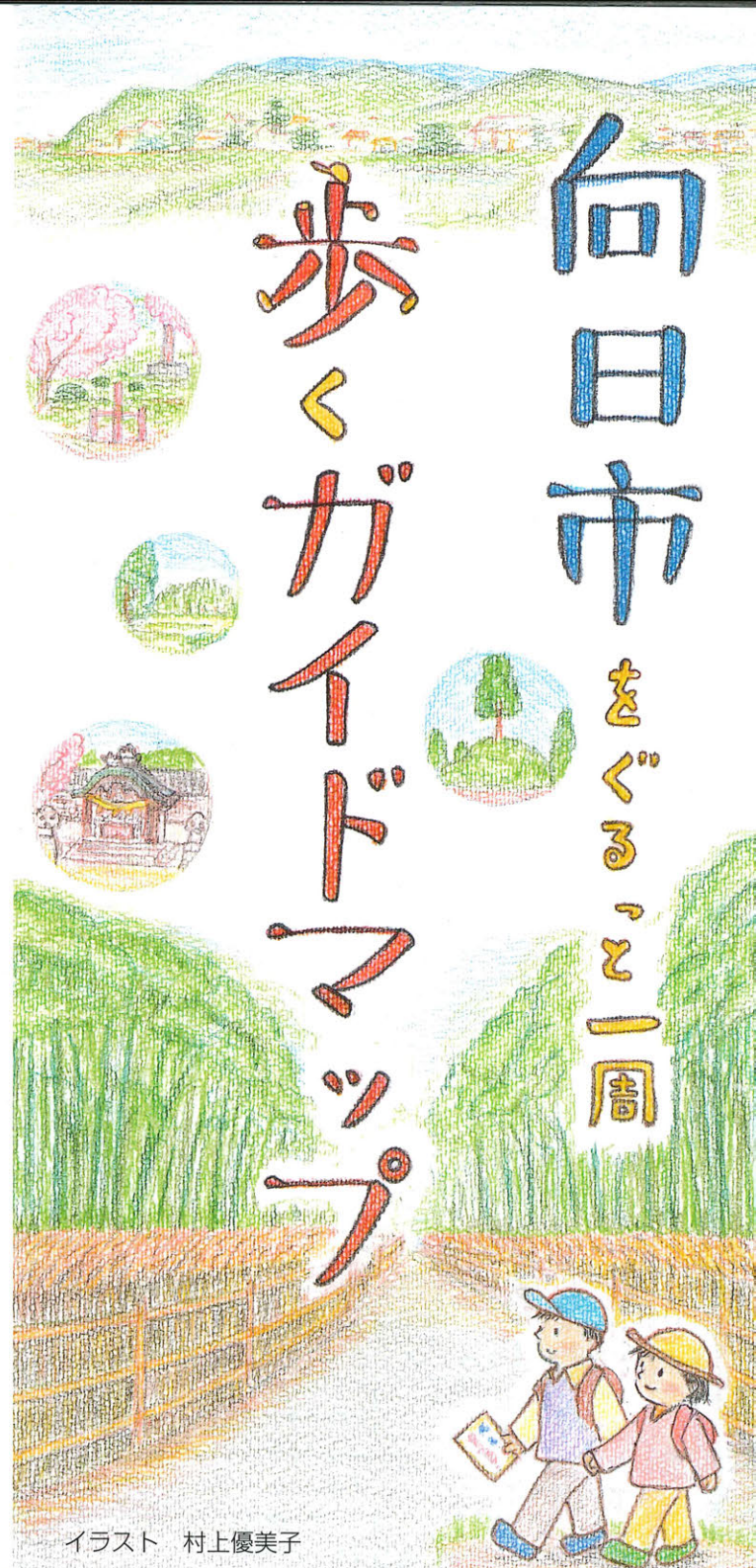
イラスト 村上優美子