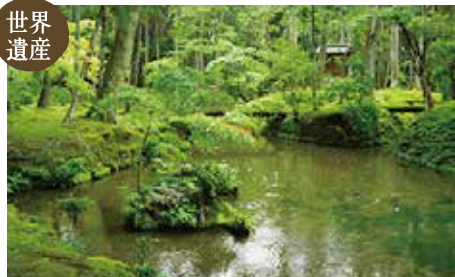
西芳寺(苔寺) (MAP E)

百種近い苔がピロードのように覆う庭の美しさから苔寺と呼ばれている。参拝には事前に往復はがきで申し込みが必要あり。