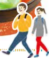
京料理 魚久 (MAP F)