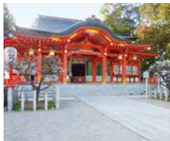
長岡天満宮 (MAP F)

学問の神様・菅原道真公自作の木像がご神体として祀られている。「キリシマツツジ」の名所としても有名。