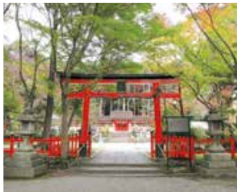
大原野神社 (MAP C-4)

長岡京市浄土谷堂/谷 無休 P100台 9:00~17:00 TEL 075-956-0017 http://yanagidani.jp/