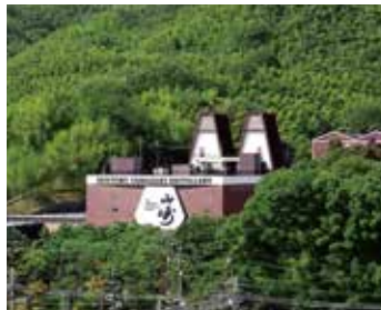
サントリー山崎蒸溜所 (MAP F)

西京区大原野小塩町 無休 P150台 8:00~17:00 TEL 075-331-0020