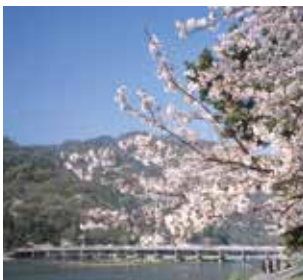
渡月橋 (MAP E)

桜、紅葉の名所として知られる嵐山を水面に映しながら流れる大堰川。渡月橋は、嵐山の優雅さをいっそう引き立てる。