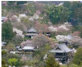
善峯寺 (MAP F)

応仁の乱で衰退後、江戸時代に將軍・綱吉の生母 桂昌院によって復興。境内の天然記念物「遊龍松」は桂昌院のお手植えとも伝えられる。