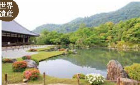
天龍寺 (MAP E)

京都五山第一位の格式を誇る天龍寺は、足利尊氏が後醍醐天皇の霊を慰めるために開いた禅寺。史跡・特別名勝に指定されている開山夢窓国師作庭の曹源池庭園は、まるで絵画のよう。