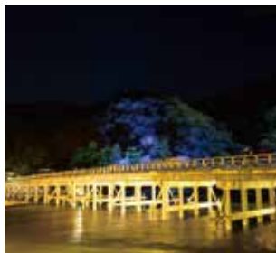
嵐山花灯路 (MAP E)

平成 17 年 12 月から京都の初冬の風物詩として嵯峨・嵐山地域にて実施。露地行灯の灯りと花により華やぎのある自然景観を演出。