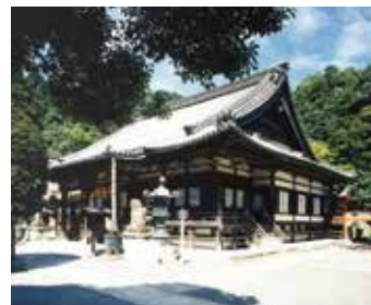
柳谷観音 楊谷寺 (MAP F)

長岡京市天神 2 丁目 無休 P60台 9:00~18:00(10~3月は~17:00) TEL 075-951-1025