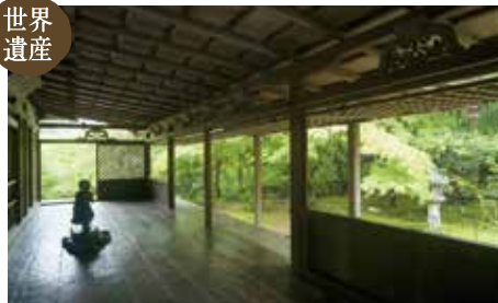
高山寺 (MAP C-3)

国宝「鳥獣人物戯画」で有名なお寺。境内には日本最古と言われる茶園があり、現在でも毎年秋に献茶式が行われる。