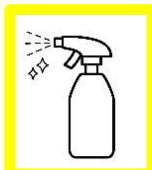
アルコール除菌や抗菌加工