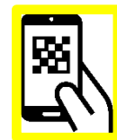
キャッシュレス・非接触システム機器の導入