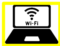
ワーケーション環境整備

新たな需要に対応するために前向きに取り組むための施設改修、システム導入等に要する経費 (令和3年6月16日以降に実施する事業に限る。)