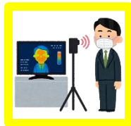
サーモグラフィーの購入

ウ 新たな需要に対応するために前向きに取り組むための施設改修、システム導入等に要する経費 (令和3年6月16日より前に実施した事業に限る。)