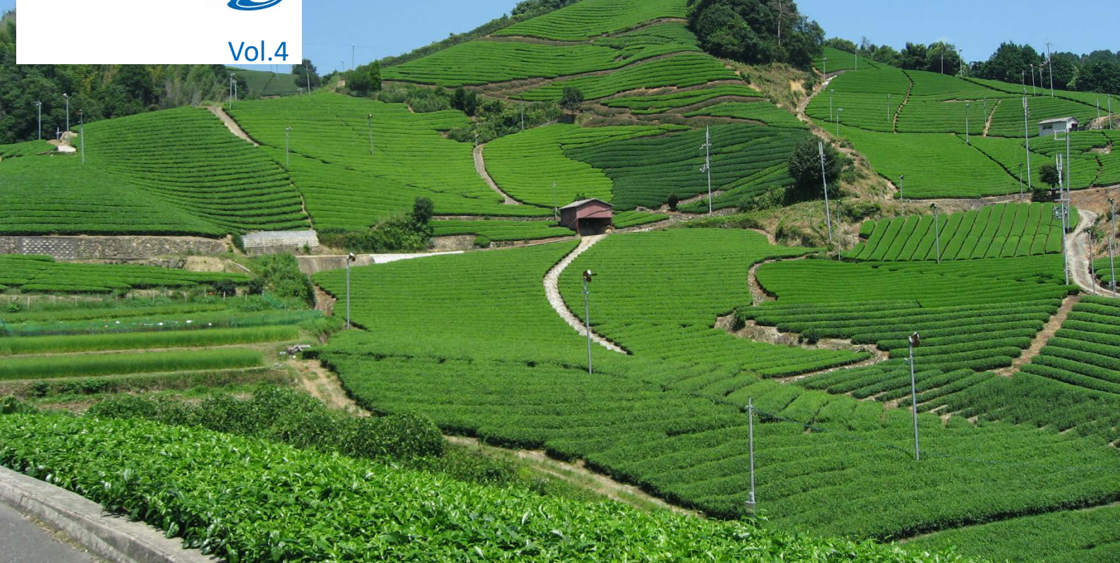
お茶の京都エリア 石寺の茶畑