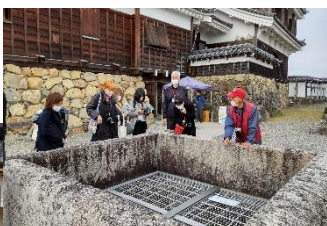
福知山城(福知山市)