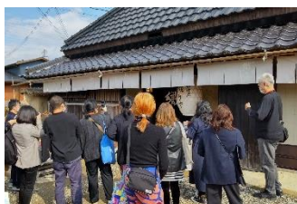
御味噌庵 織りや(綾部市)