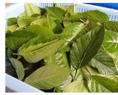
■収穫した大島桜の葉