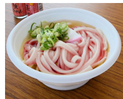
■昼食 桜うどん(イメージ)