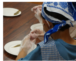
■さくら餅づくり体験