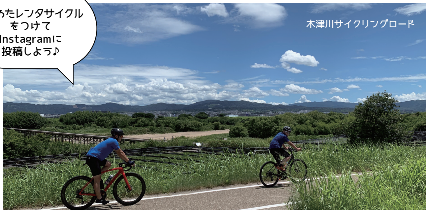
木津川サイクリングロード